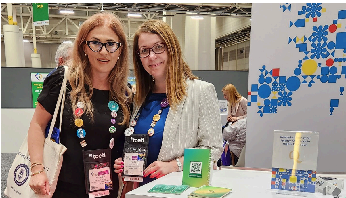
2. EAIE International Educational Fair, Toulouse, Franța (17-20 Septembrie 2024)