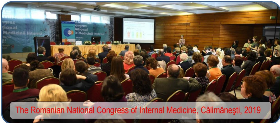
The Romanian National Congress of Internal Medicine, Călimănești, 2019